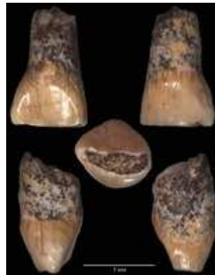
Incisivo superiore da latte del bambino de La Pineta (foto di Claudio Berto, elaborazione di Julie Harnaud)

Alle numerose informazioni che si sono potute trarre con lo scavo e lo studio dei materiali, ora si aggiungono quelle importanti sulle caratteristiche fisiche del protagonista dell'insediamento paleolitico così che quanto è stato esplorato, recuperato, restaurato e studiato in tanti anni di lavoro acquista ora una dimensione ancora più umana.